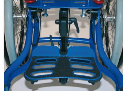
Abdusert ramme / fotstøttesystem